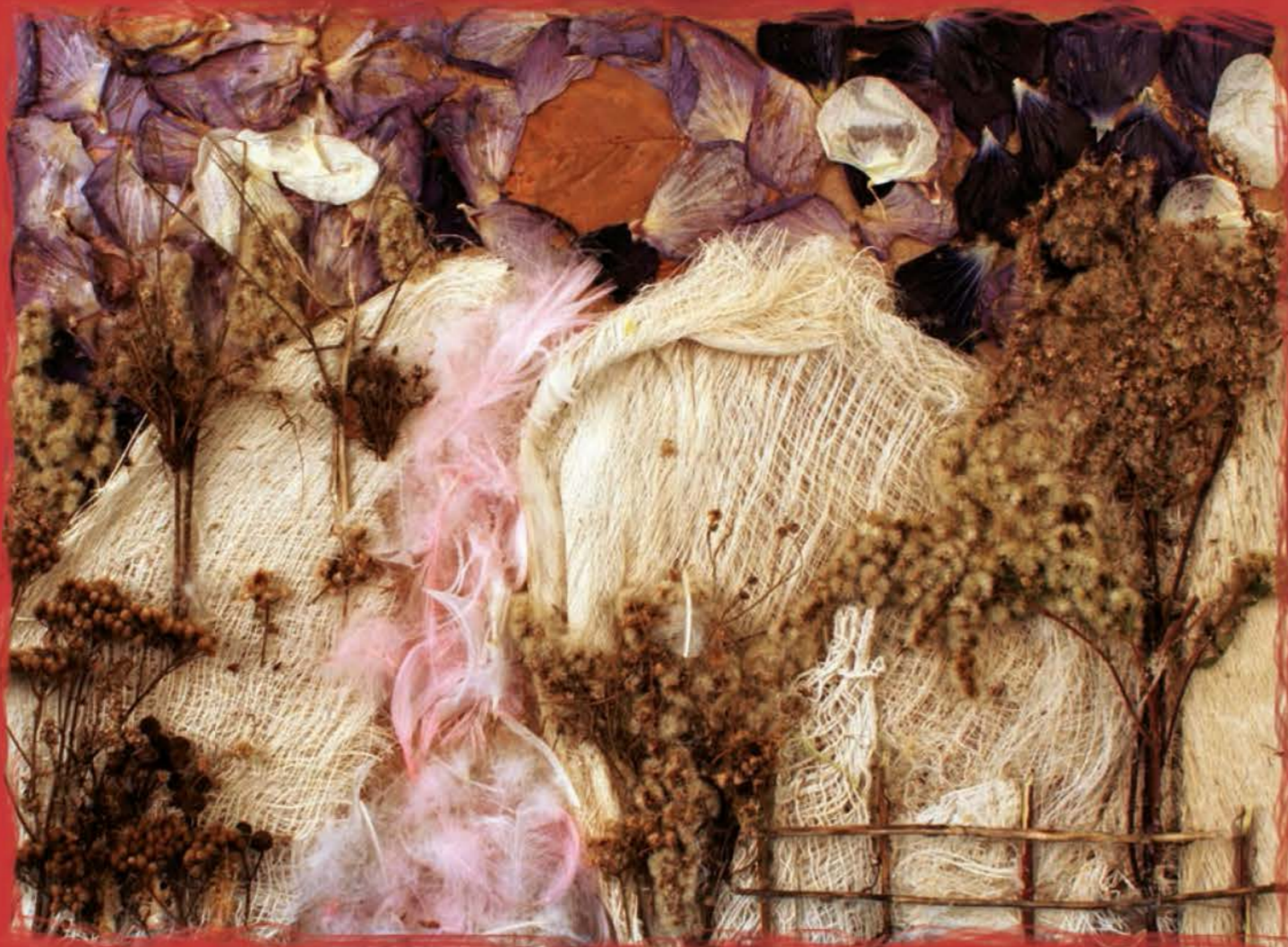
Miłkołaj Szpala, SP w Borcu Starym