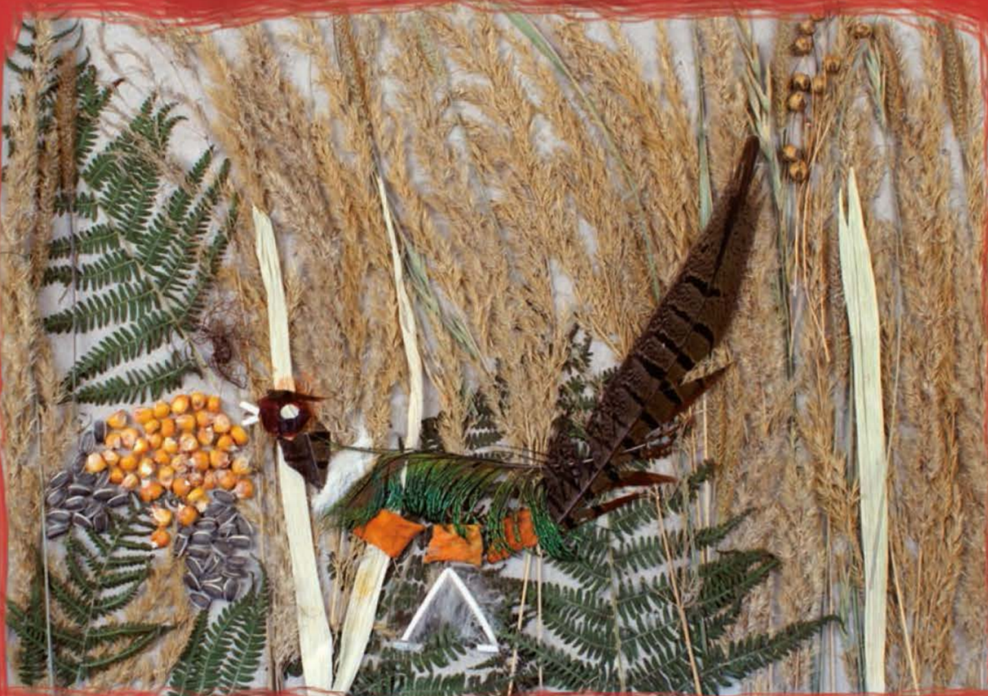
Izabela Łuczyn, SP nr 25 w Rzeszowie