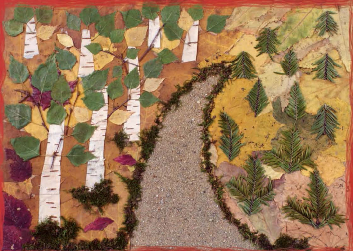
Wiktoria Krypel, SP nr 5 w Ropczycach