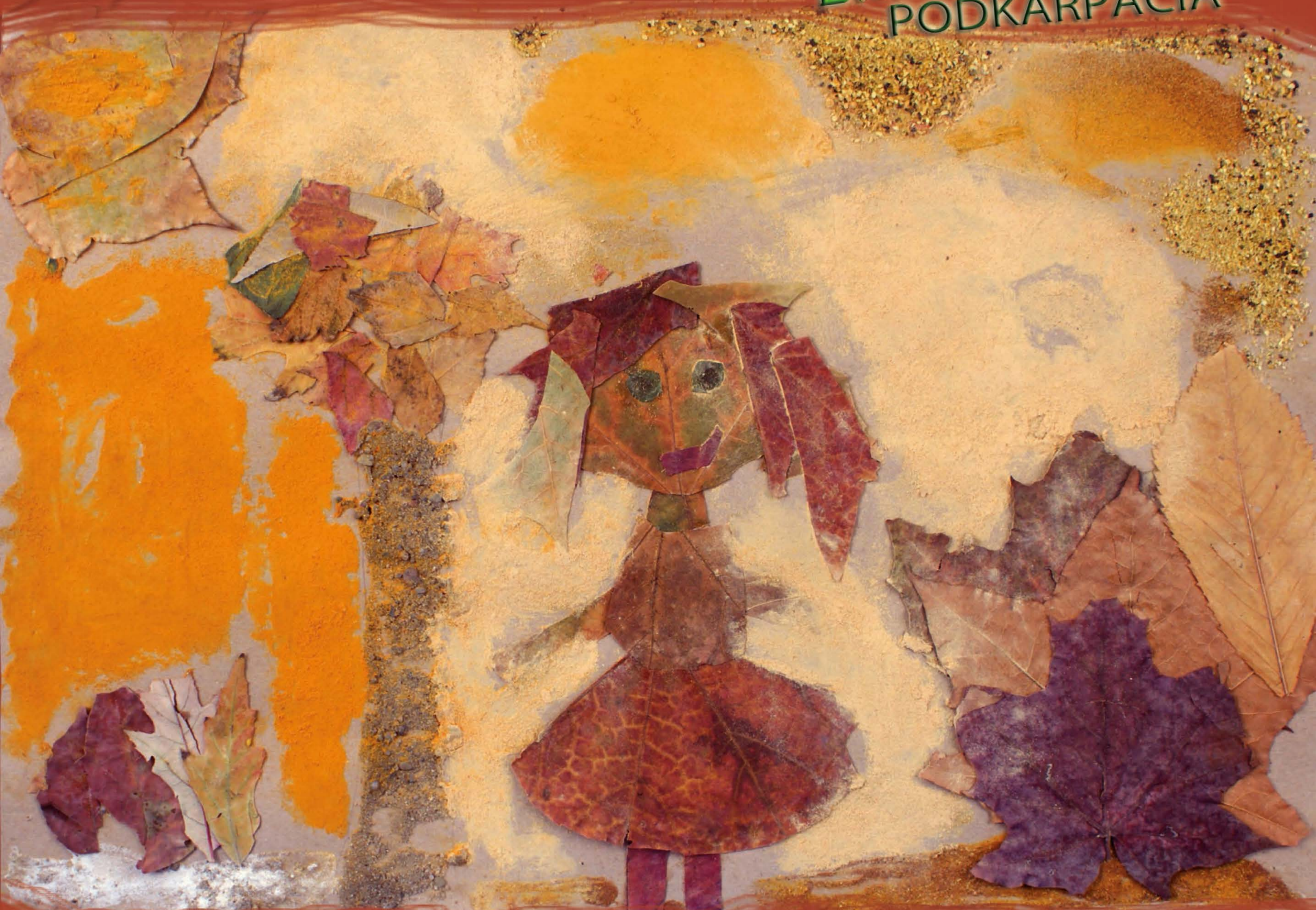
Anna Morawska, SP nr 10 w Rzeszowie